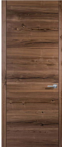
Amerikanisch Nuss Crack American Walnut Crack