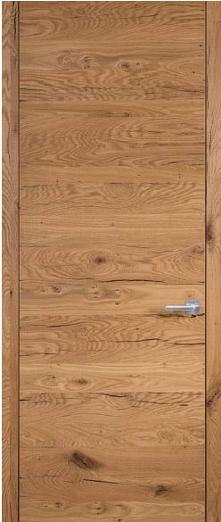
Eiche rough Crack Oak rough Crack