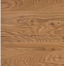
Eiche rough Crack Oak rough Crack