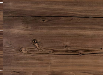
Amerikanisch Nuss mit schwarzem Untergrund American Walnut with a black base coat