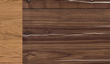
Amerikanisch Nuss mit weißem Untergrund American Walnut with a white base coat