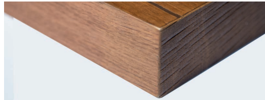
TAVOLA Tischplatte broncé+ 1822 Ecke TAVOLA Tabletop broncé+ 1822 corner