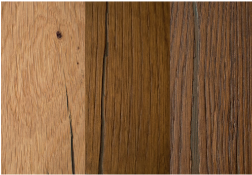
TAVOLA Tischplatte natur / broncé+ 1821 / broncé+ 1822 TAVOLA Tabletop natural / broncé+ 1821 / broncé+ 1822