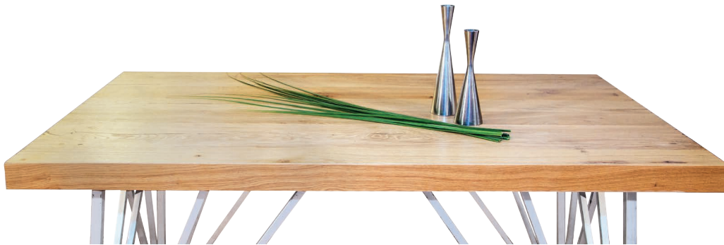
Tavola Tischplatte TAVOLA Tabletop