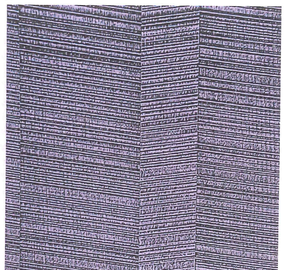
Eine weitere Variante zur Gestaltung neuartiger Möbeloberflächen